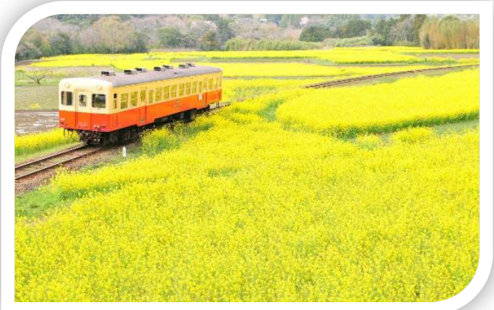
石神の菜の花畑 (上総大久保と養老溪谷の間)